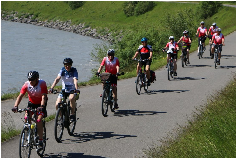
auf dem Rheindamm bei Buchs SG

Wir wünschen allen eine unfallfreie Saison 2020 und viel Spass!