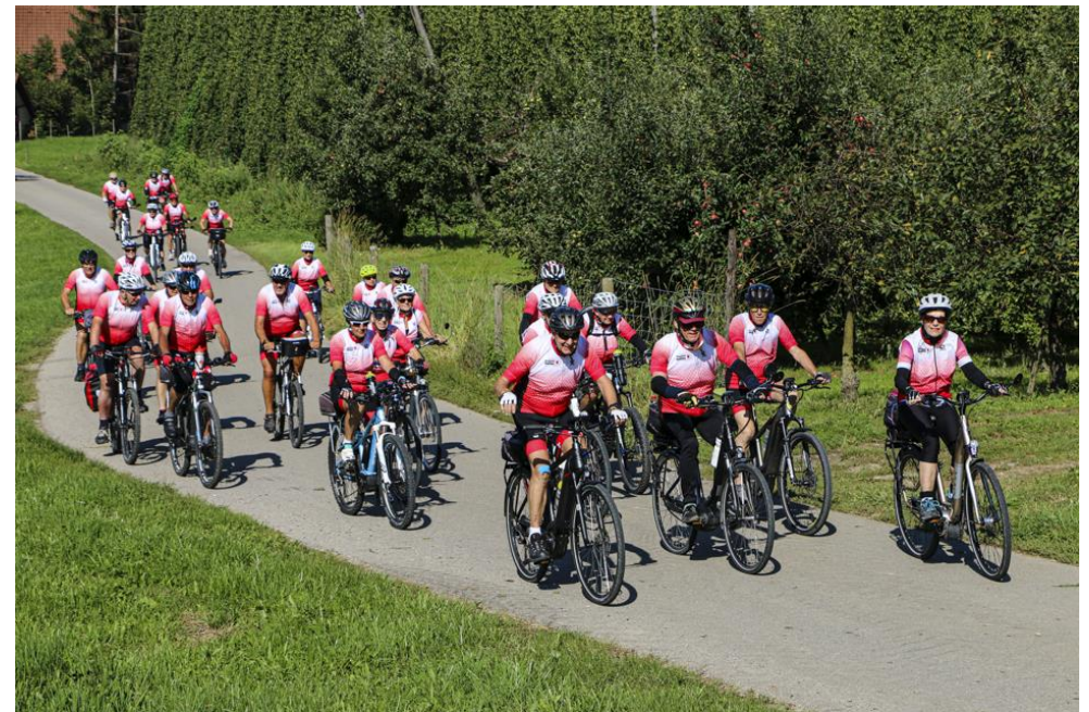
Unterwegs auf der Hopfenstrasse anlässlich der Velo-Woche 2019 in D-Bitzenhofen