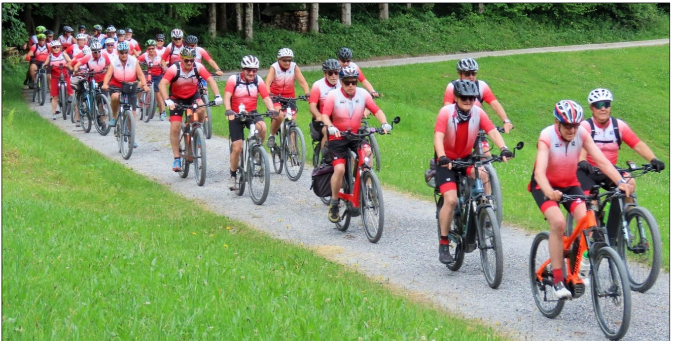
Vom Etzelpass zur Diebishütte ob Altendorf

Wir wünschen allen eine unfallfreie Saison 2026 und viel Spass!