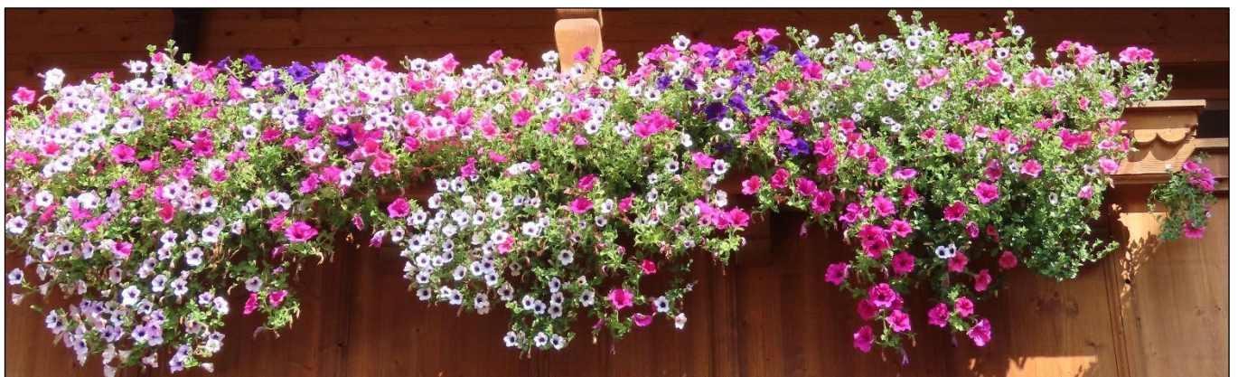
Ein Balkon in Alpbach (A) geschmückt mit hübschen Blumen